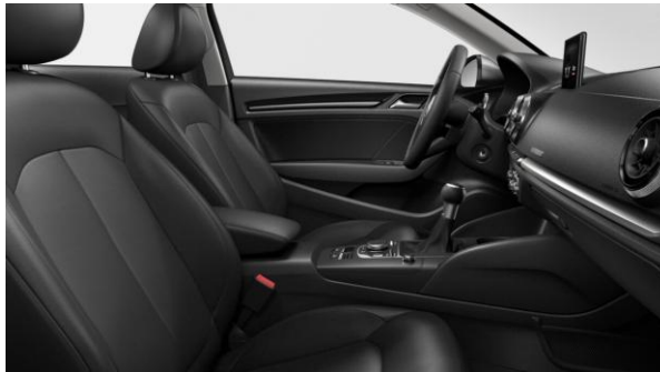
Tapizado de asientos en cuero parcial