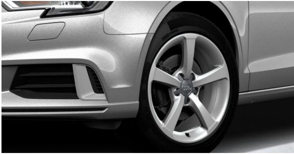
Llantas de aleación ligera 7,5J x 17. Diseño "estrella" de 5 brazos. Con neumáticos 225/45 R 17