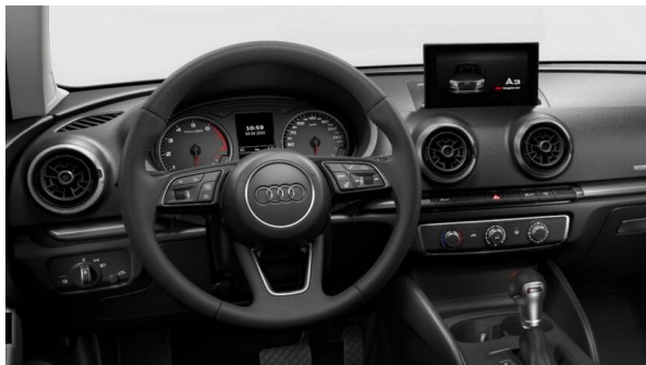
Volante multifuncional plus de 3 rayos, tapizado en cuero