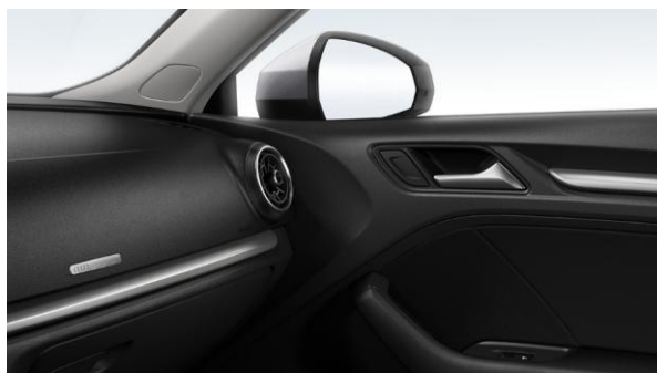
Inserciones decorativas en Micrometallic (Plata)