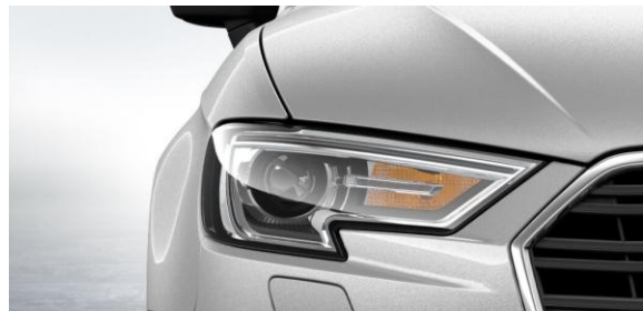
Nuevo diseño faros Xenón plus